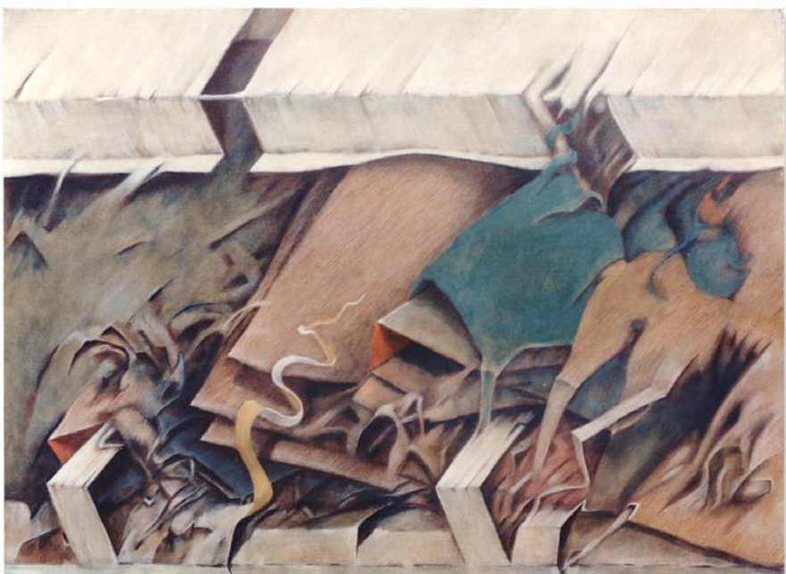
SOMETHING6 80.3x100.0cm 1986年油彩、 テンペラ（同時期）