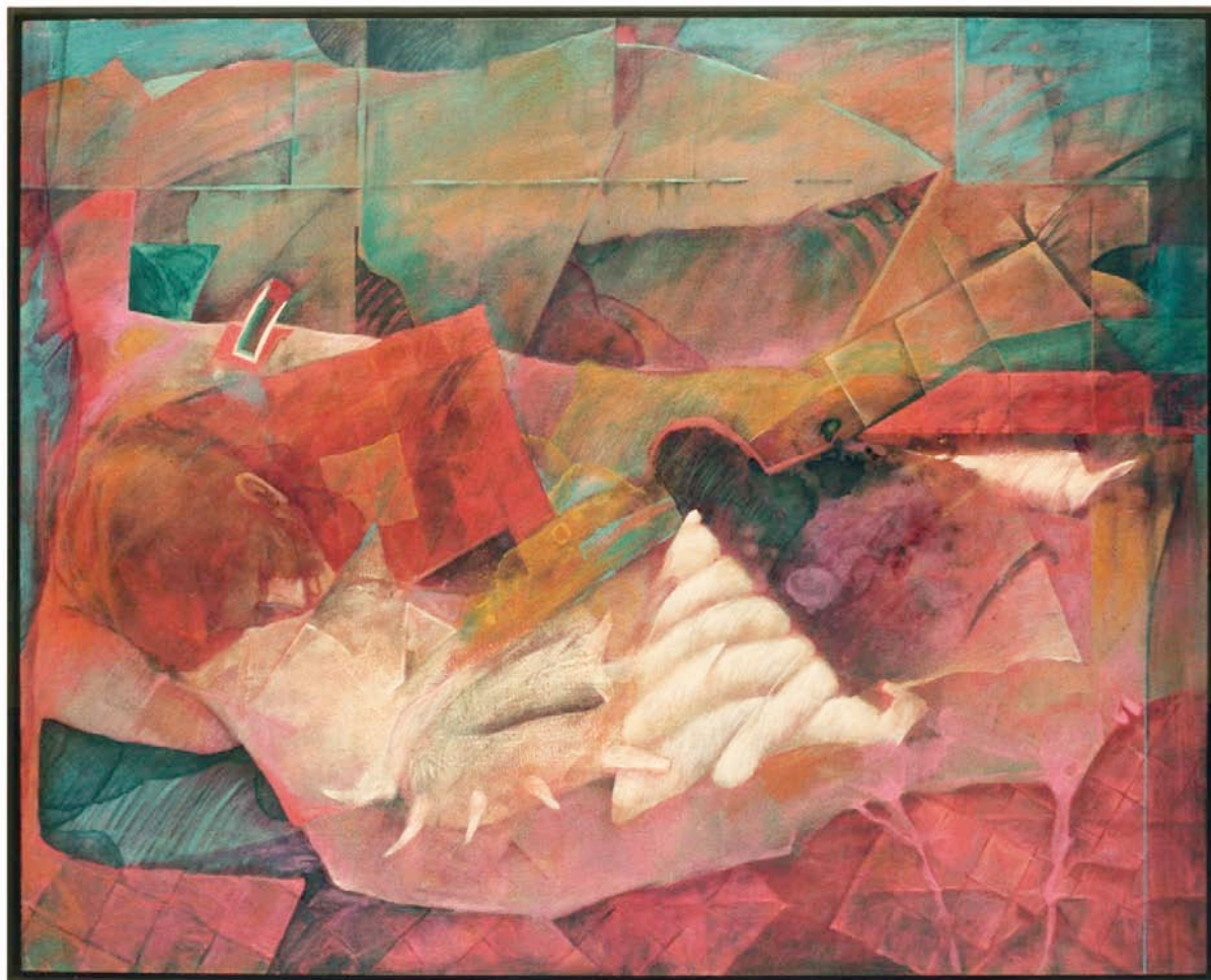
ドシソファミド 130.3x162.0cm 1986年 油彩、テンペラ