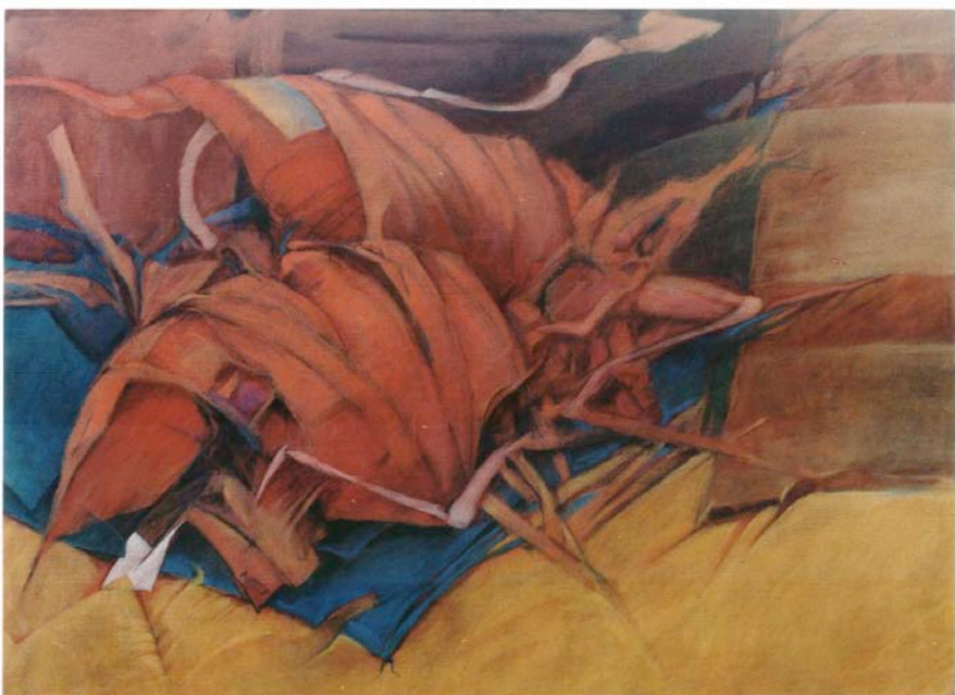
SOMETHING2 80.3x100.0cm 1986年油彩、 テンペラ（同時期）