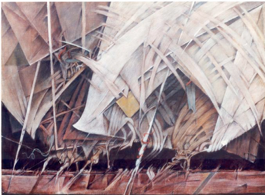
SOMETHING3 80.3x100.0cm 1986年油彩、 テンペラ（同時期）