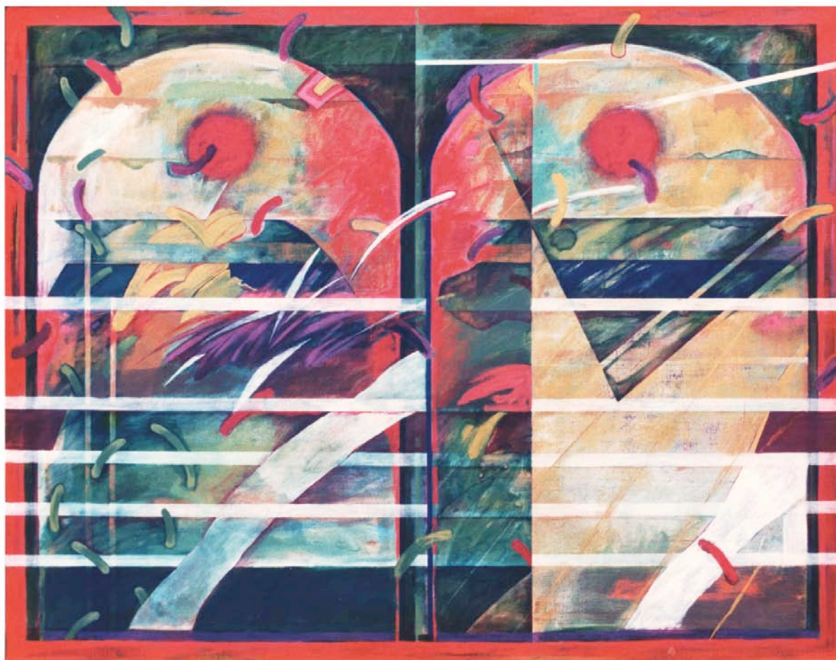
右と左 130.3x162.0cm 1986年 油彩、テンペラ