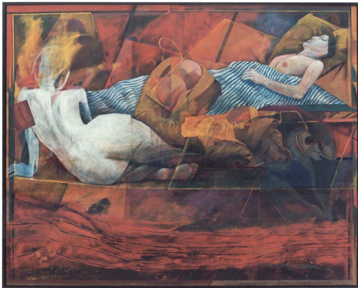
けむりにまかれてA 130.3x162.0cm 1986年 油彩、テンペラ