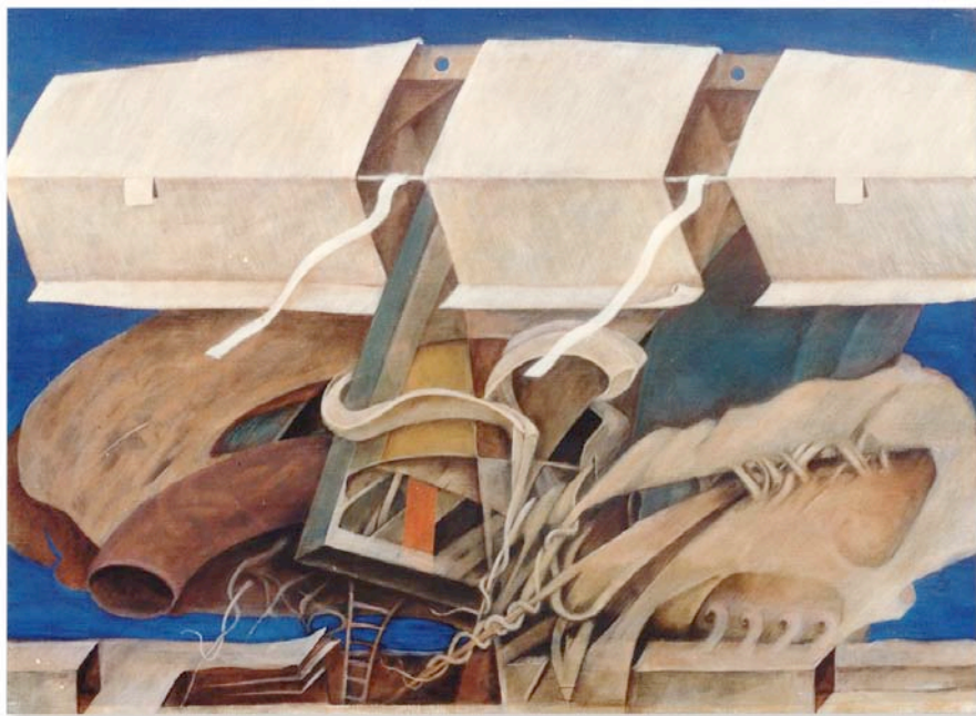
SOMETHING5 80.3x100.0cm 1986年油彩、 テンペラ（同時期）