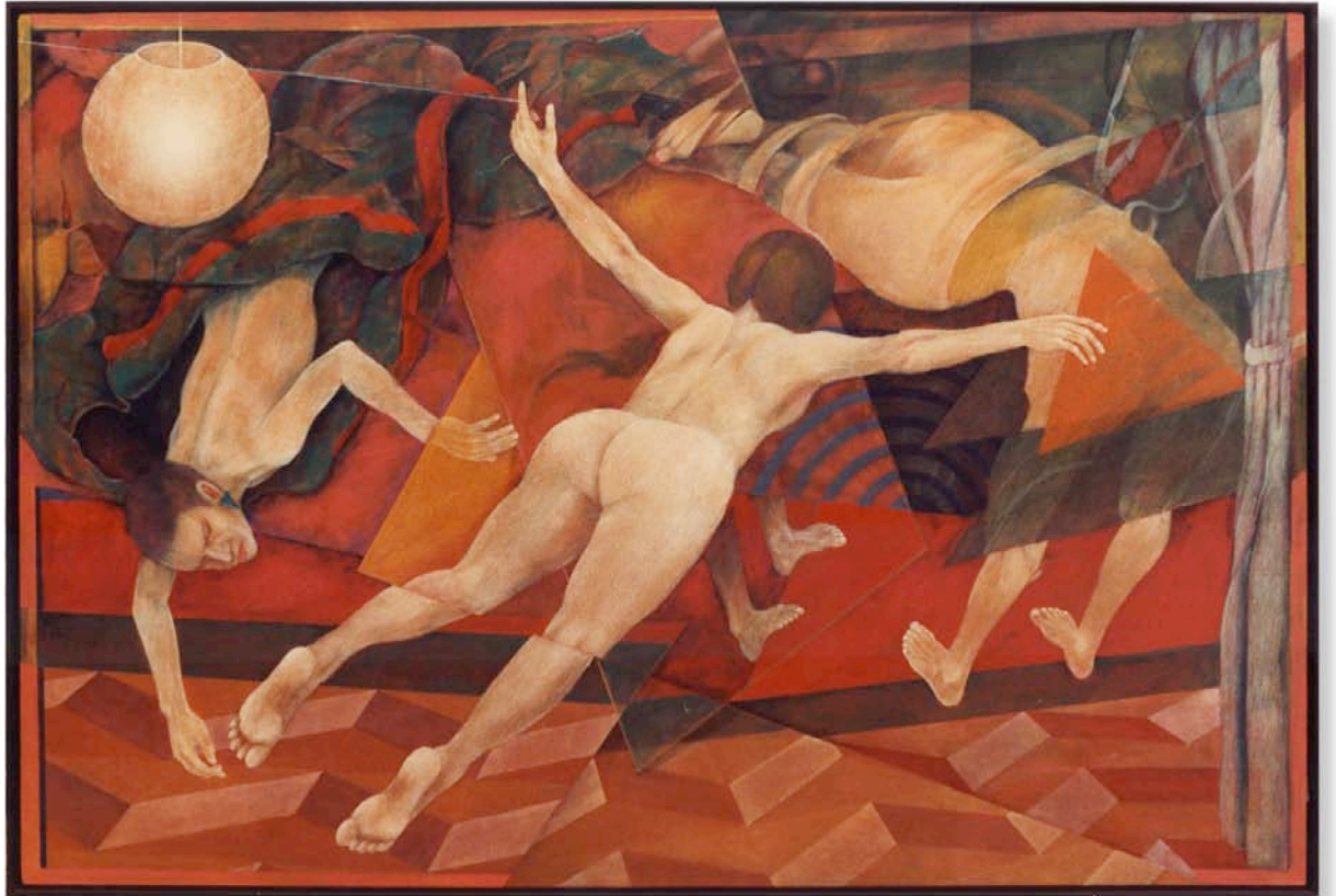
けむりにまかれてB 130.3x194.0cm 1986年 油彩、テンペラ