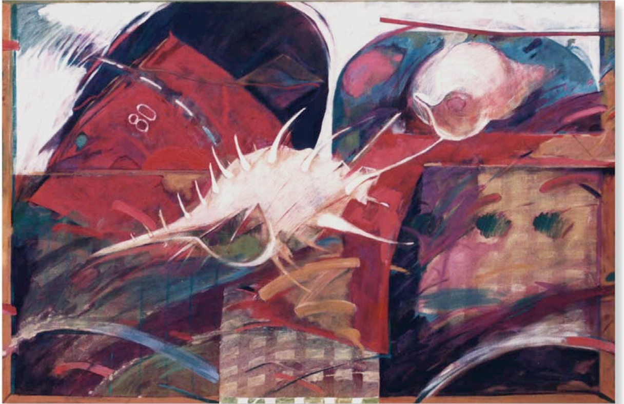
トンネルぬけて 130.3x194.0cm 1986年 油彩、テンペラ