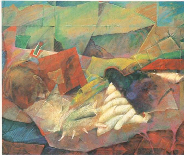
「ドシソファミド」、F100、油彩・テンペラ