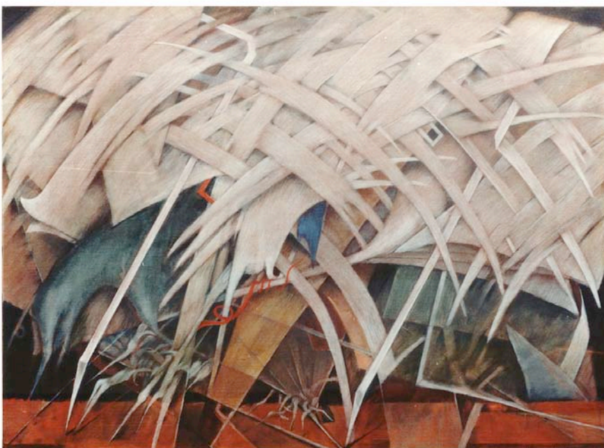
SOMETHING4 80.3x100.0cm 1986年油彩、 テンペラ（同時期）