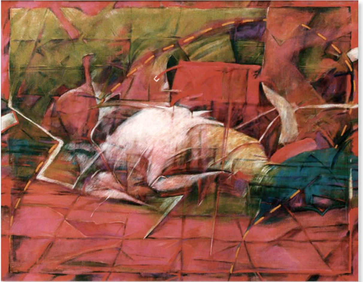
チューニング 130.3x162.0cm 1986年 油彩、テンペラ